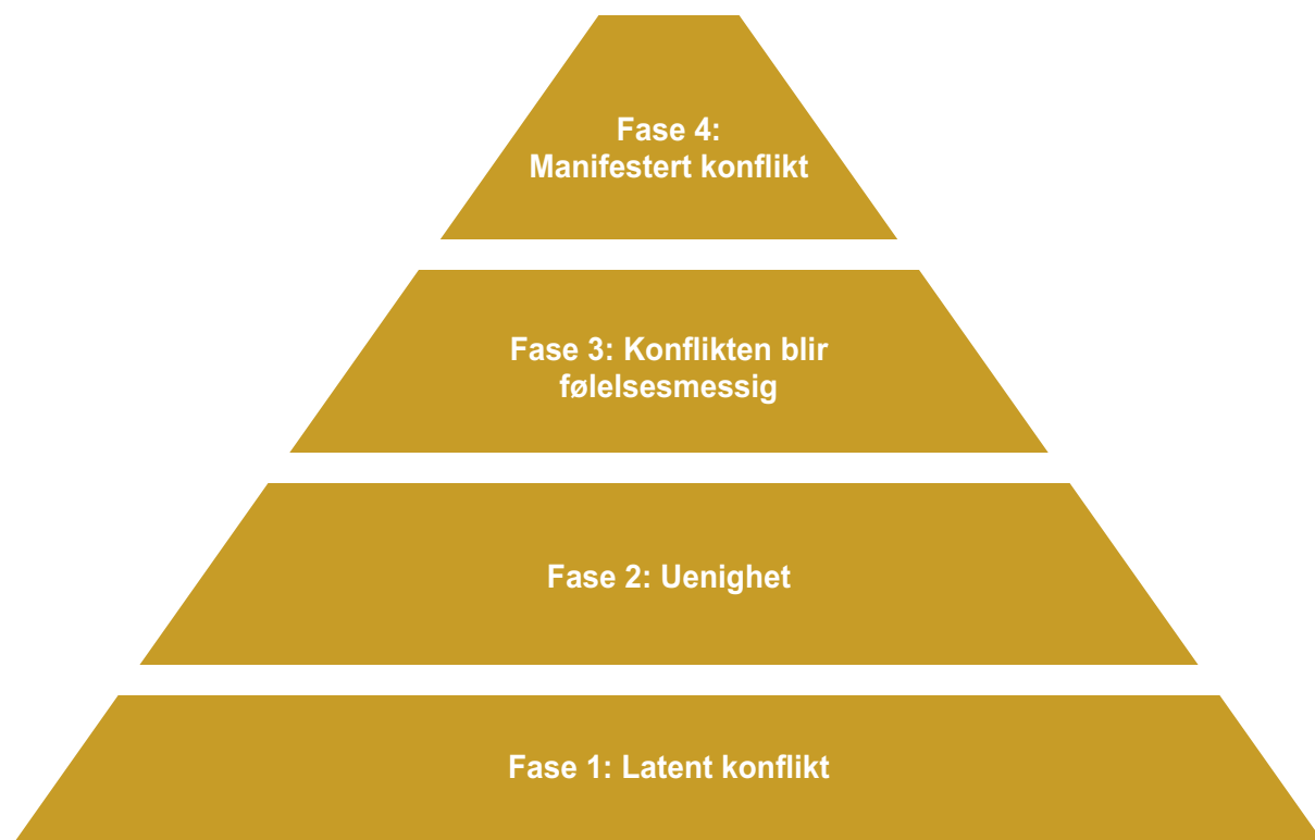
Figur 1. En firedelt modell for eskalering og beskrivelse av konflikter (se kapittel 10).

Denne modellen er benyttet som utgangspunkt for de spørsmålene barnevernsarbeiderne er stilt og vi kan derfor kategorisere svarene deres slik at de teoretisk sett forteller oss noe om hvor alvorlig konflikten opplevdes og hva som karakteriserer den, se tabell 3. Når de ansatte i barnevernstjenesten ble bedt om å ta utgangspunkt i den siste høykonfliktsaken de hadde ansvar for og krysse av for de beskrivelsene de synes var treffende for denne situasjonen slik de opplevde det, finner vi at henholdsvis få av sakene (7%) eskalerer til nivå 4 hvor samarbeidet bryter sammen og den ansatte ikke lenger kan være saksbehandler i saken. Det er likevel en fjerdedel (25%) som opplevde at det var åpen fiendtlighet mellom dem og foreldrene, noe som kan føre til destruktiv aktivitet og dårlig problemløsning. Det er videre liten tvil om at konfliktsakene når et nivå hvor sakene blir personlige og følelsesmessige, hvor mellom 31-41% av de spurte barnevernsarbeiderne karakteriserer konflikten på en slik måte at konflikten befinner seg innenfor fase 3.